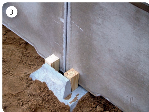
Rännväggarna kilas i fundamenten.