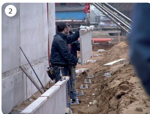
Montagearbetet går snabbt och enkelt.