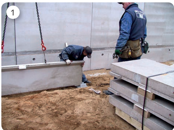
Elementet monteras i de utsatta fundamenten. Lyfthuvud för skruvhylsor används vid montering.