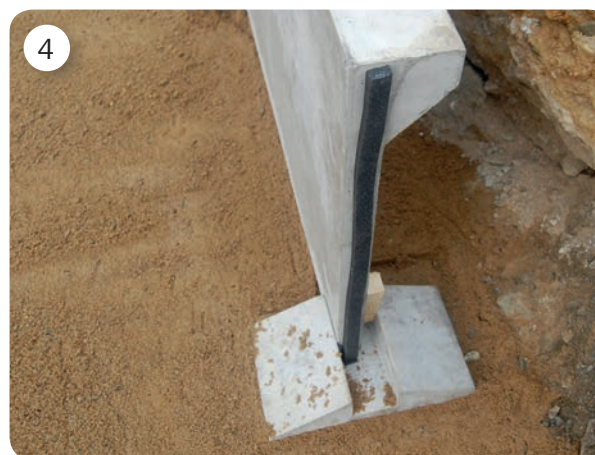
1 st tätningstlist monteras i skarven mellan rännsidorna.