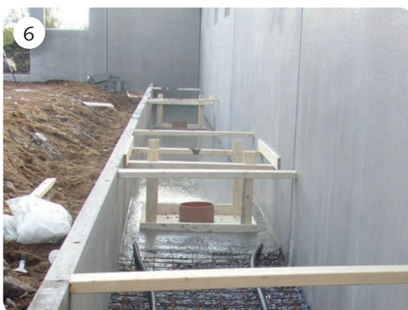
När samtliga rännväggar är på plats, gjuts botten i gödselrännan. Elementen stagas innan återfyllning och komprimering.