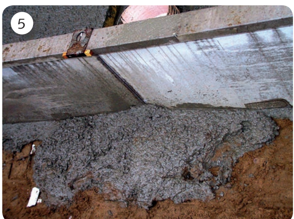
Tack vare elementens utformning gjuts väggen fast i samband med rännjutningen.